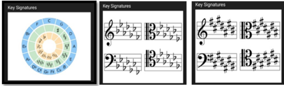
شكل (2) تطبيق Vivace