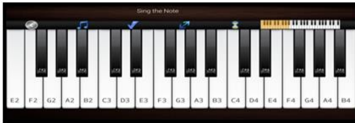
شكل (1) تطبيق Voice Training